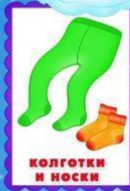
КОЛГОТКИ И НОСКИ