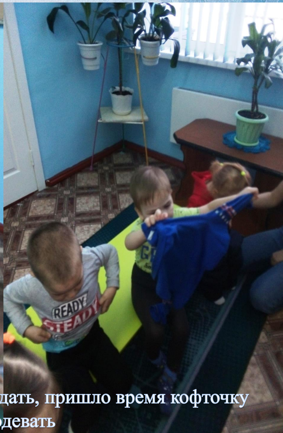
Посмотри, на улице стало холодать, пришло время кофточку деткам одевать