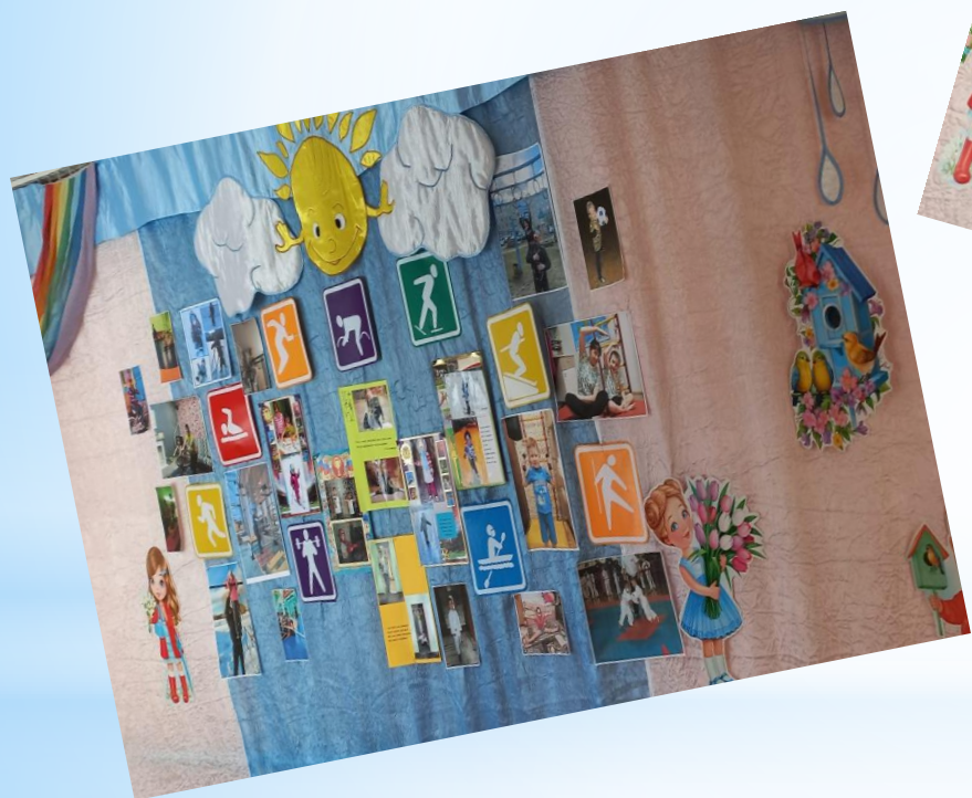
ФОТО ВЫСТАВКА ЗОЖ В СЕМЬЕ «ЗОЖИГАЕМ»