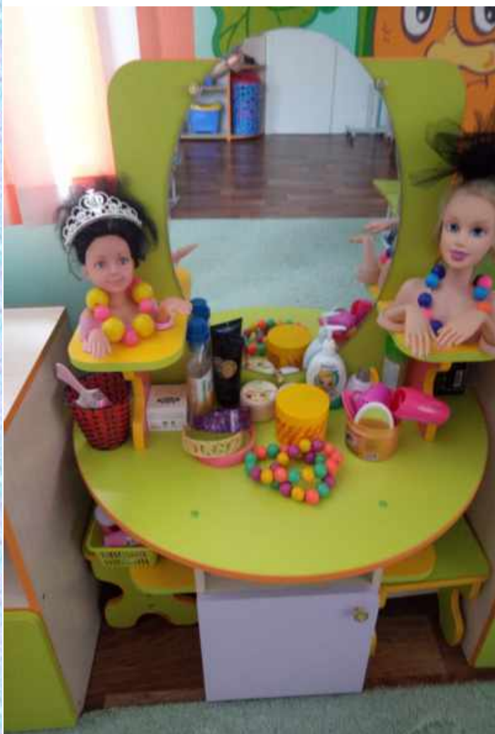
Сюжетно-ролевая игра «Салон красоты»