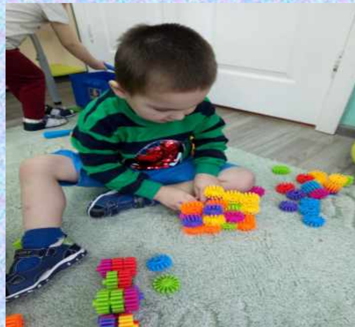
Конструирование в свободной деятельности