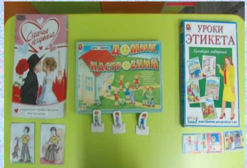
Дидактические игры социально-нравственной направленности