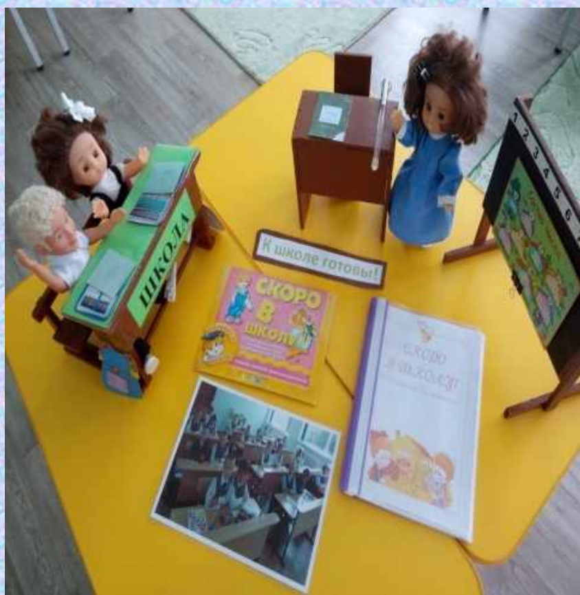
Сюжетно-ролевая игра «Школа»