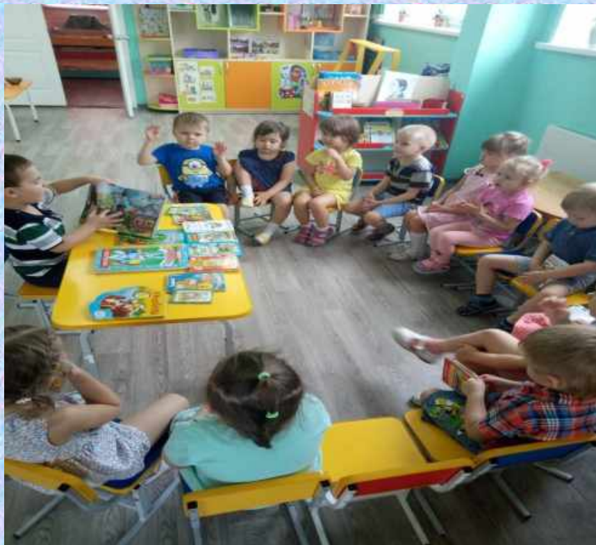
Беседа по теме «Моя любимая книга»