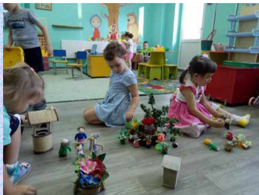
Театрализация в самостоятельной деятельности детей