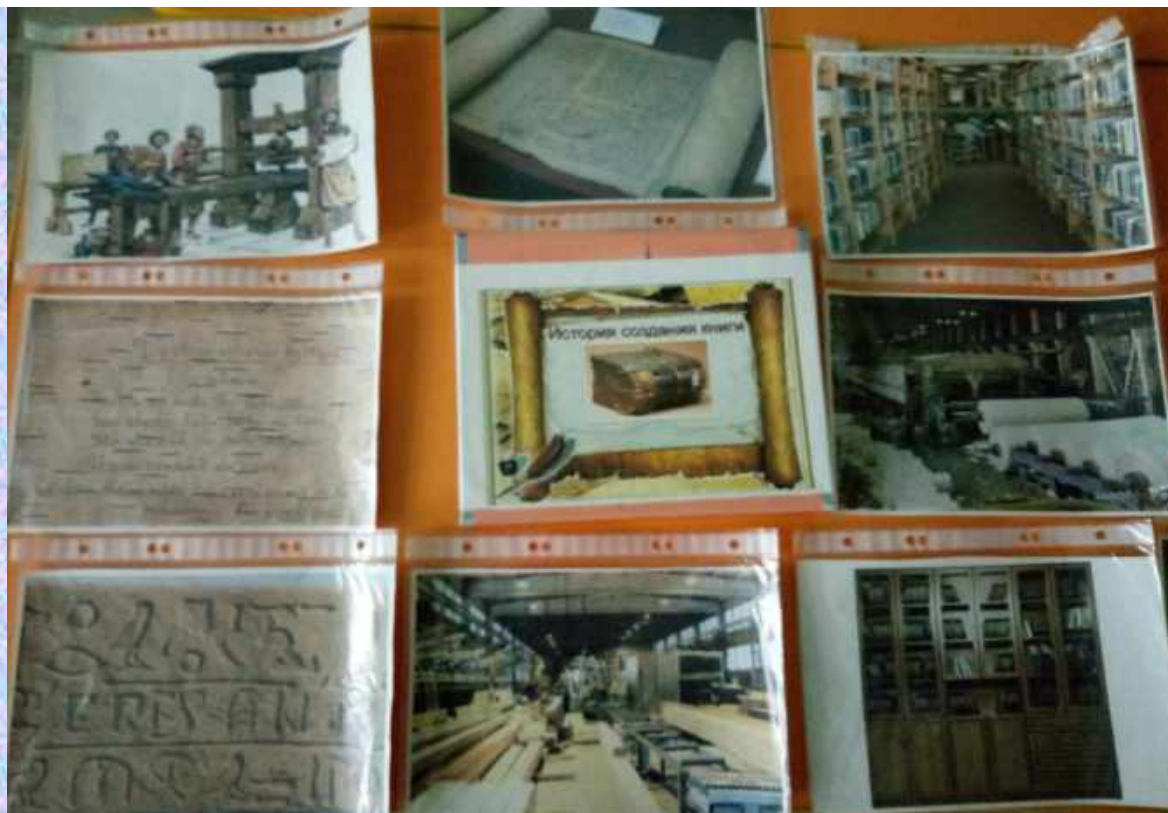
Иллюстративный материал «История создания книги»