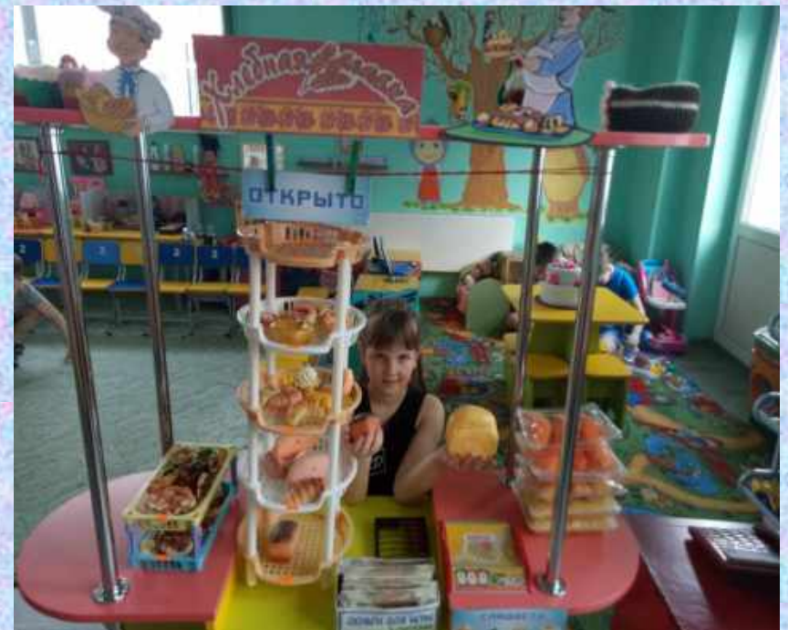
Сюжетно-ролевая игра Магазин «Хлебная лавка»