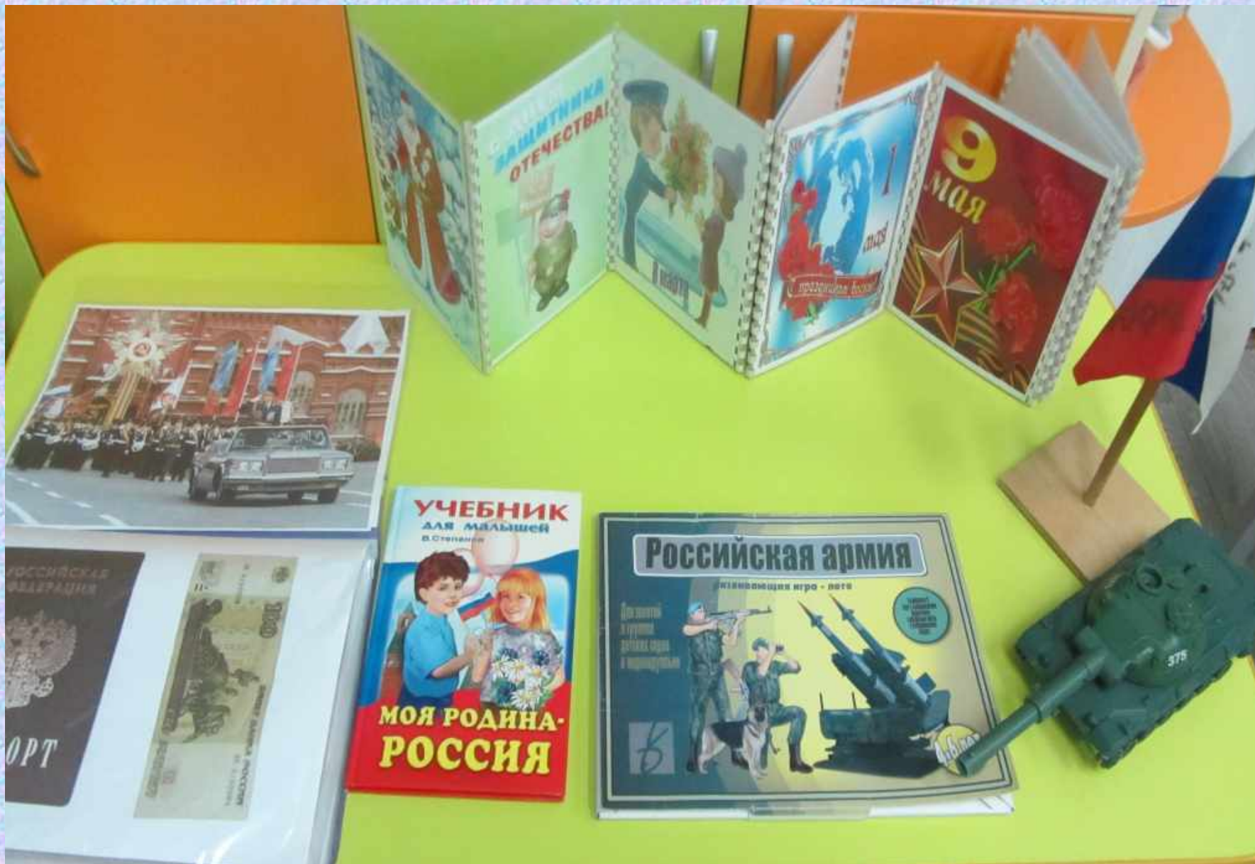
Тематическая неделя «Служу России!»