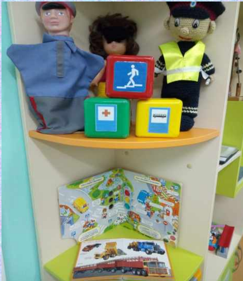
«Советы инспектора ГИБДД»