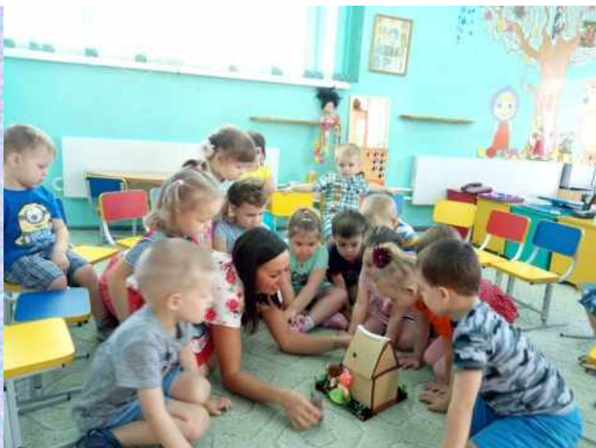
Театрализация в совместной деятельности с детьми