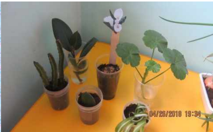
Исследовательская деятельность «Размножение комнатных растений черенкованием»