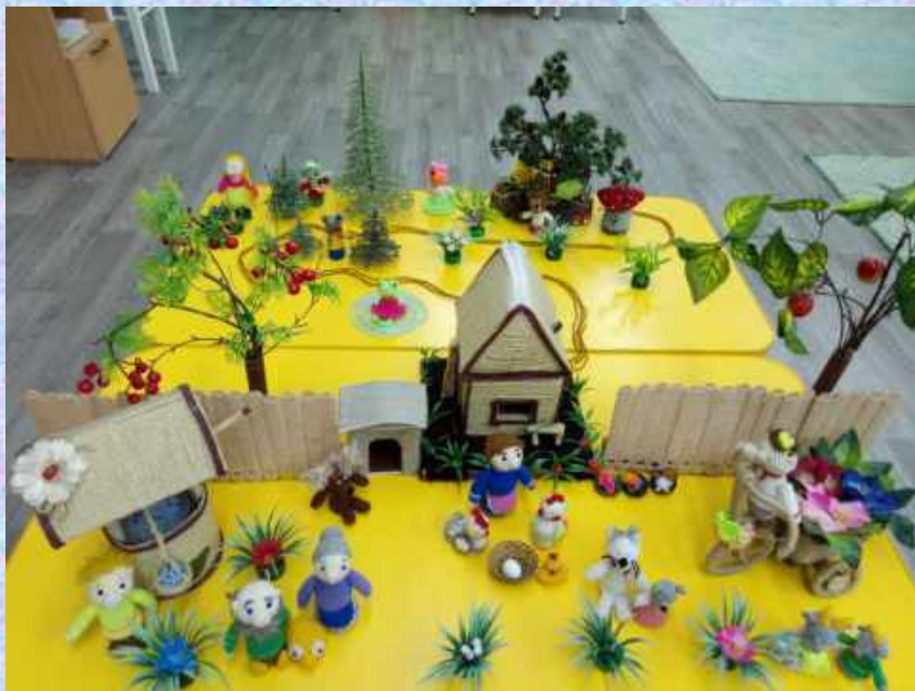
Настольный театр вязаной игрушки

-Игрушки в шкатулках сидят и ждут ребят!