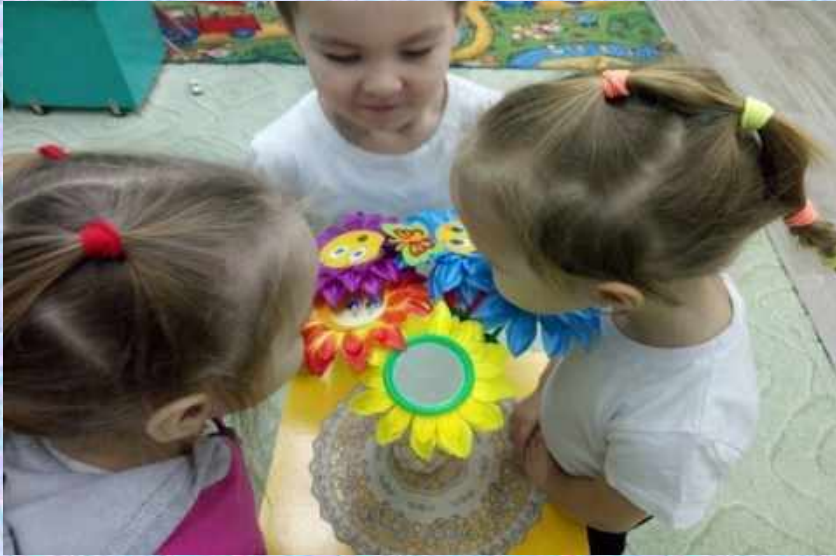
Дидактическое пособие «Букет настроений»