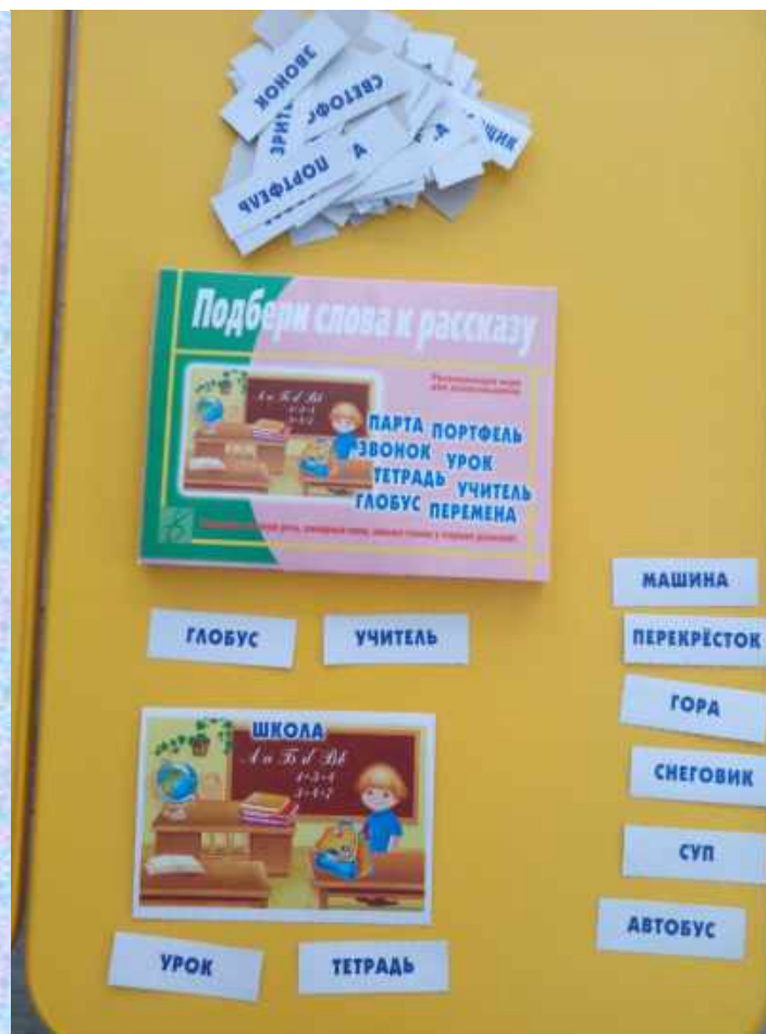
Дидактическая игра «Составь рассказ»