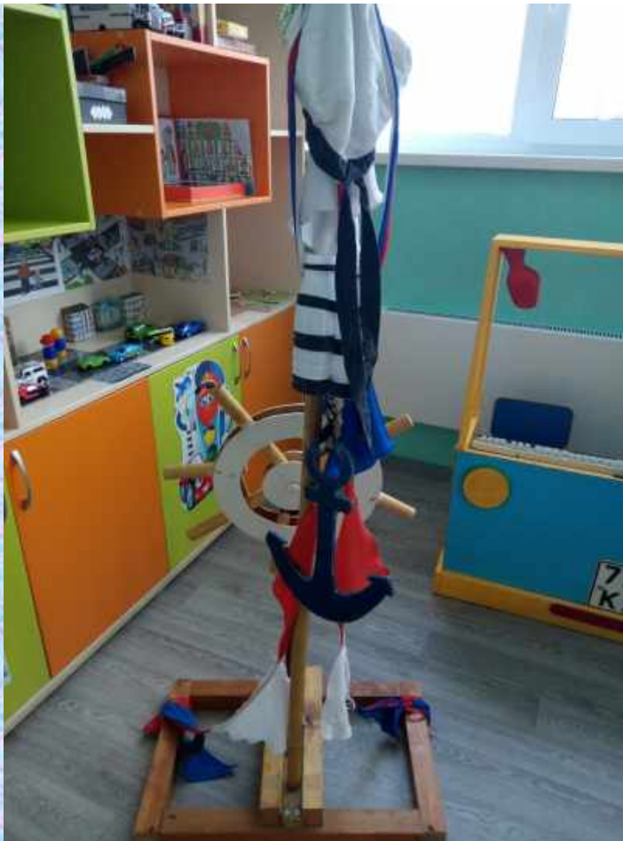
Сюжетно-ролевая игра «Путешествие на корабле»