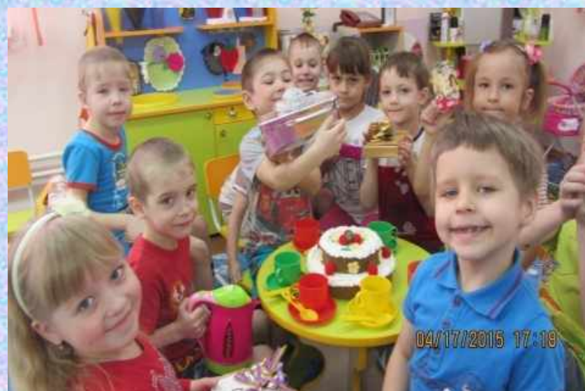
Сюжетно-ролевая игра «День рождения»