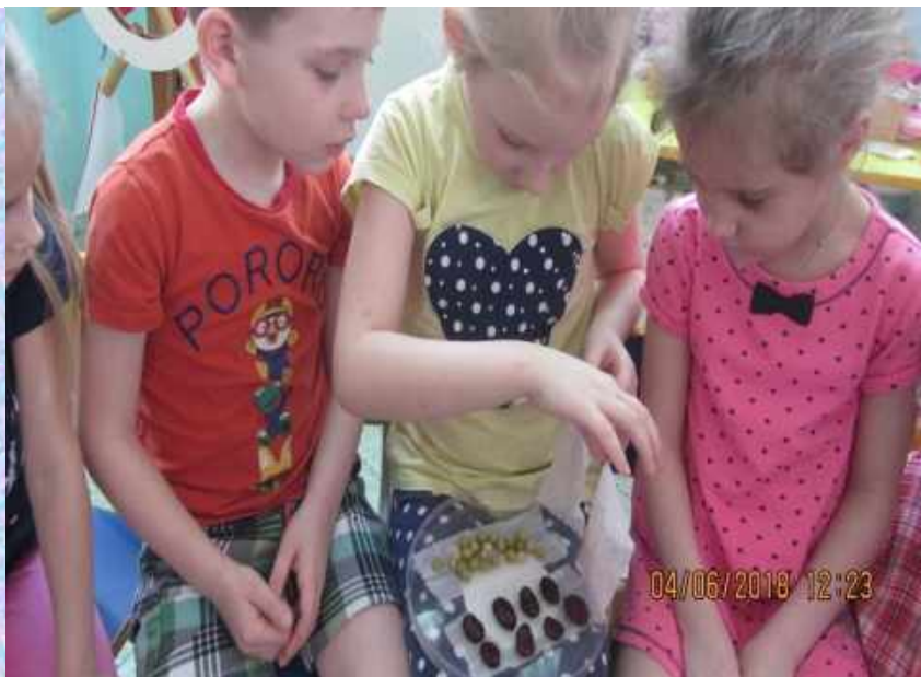
Наблюдение «Проращивание семян»