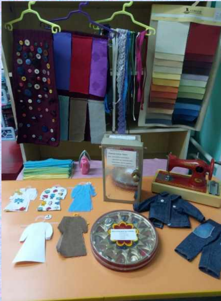
Сюжетно-ролевая игра «Ателье»