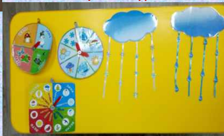
Дидактическое пособие «Время года»