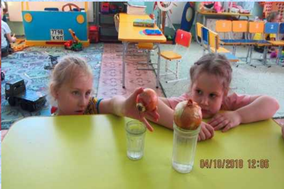
Наблюдение «Проращивание лукавицы»