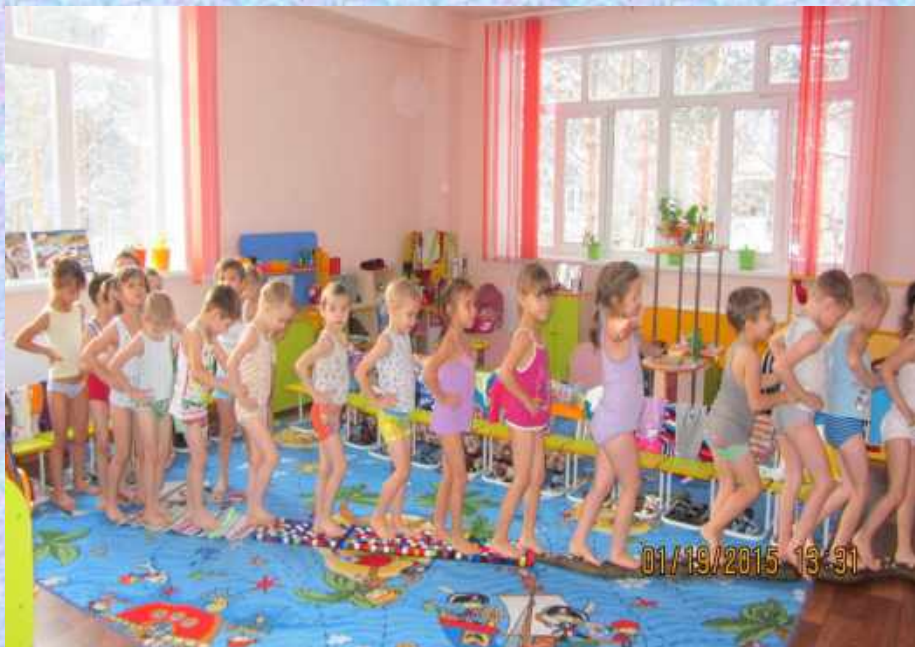
Ходьба по змейке, пробковой, ребристой дорожке