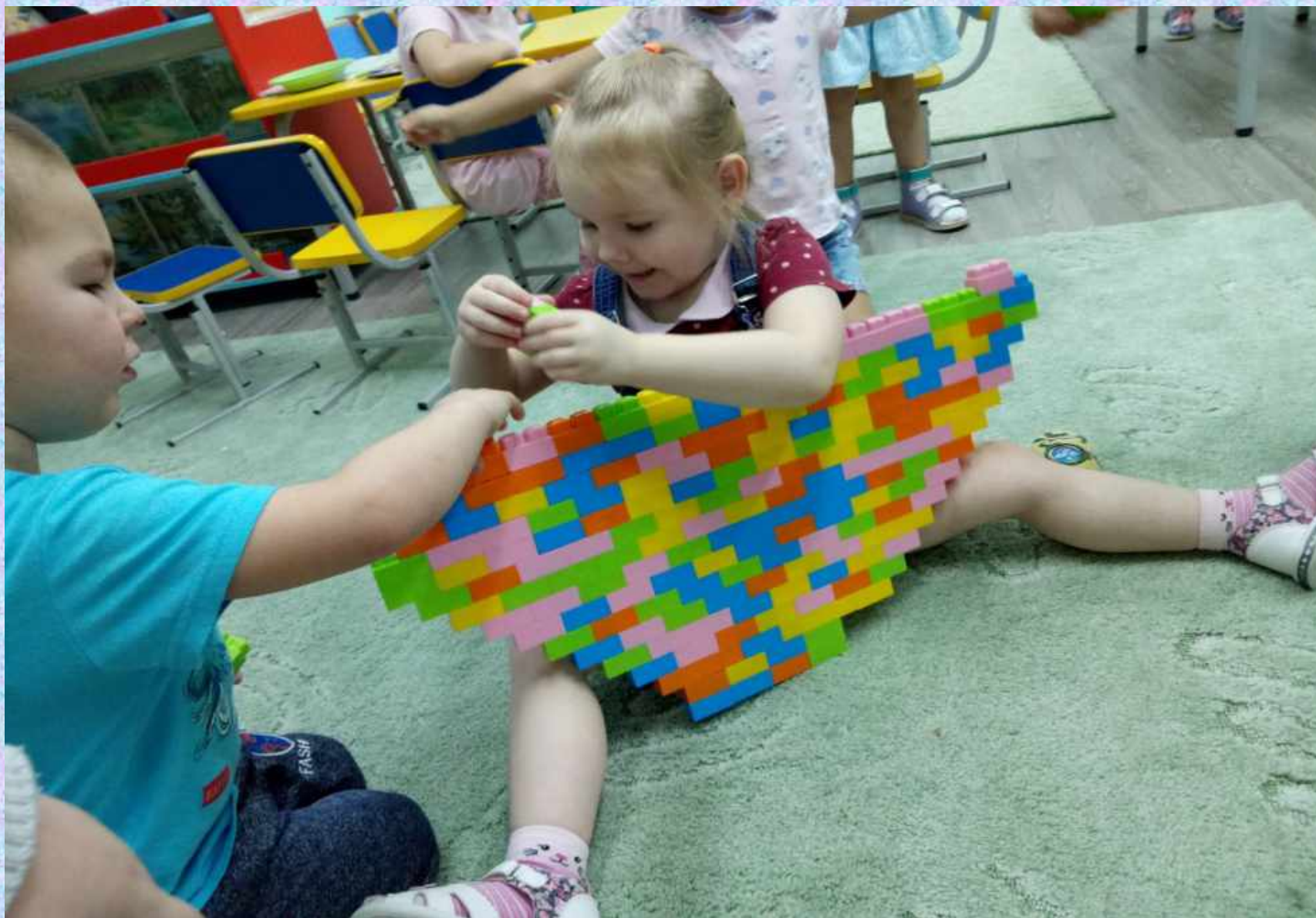
Конструирование в свободной деятельности детей