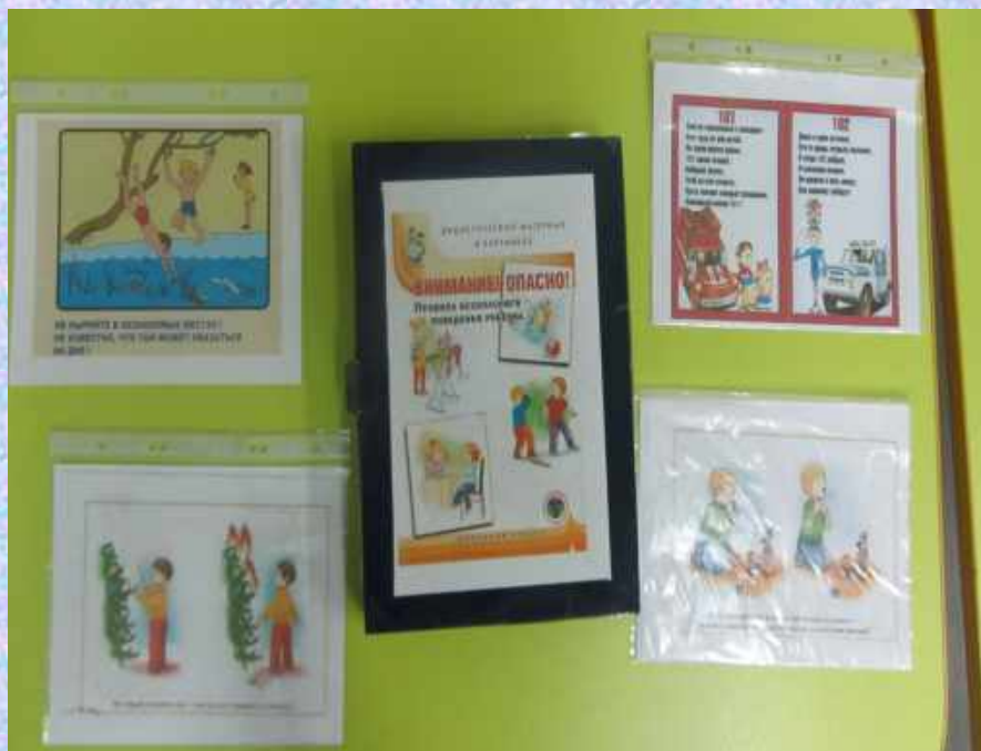
Иллюстрации «Огонь-друг и враг человека»