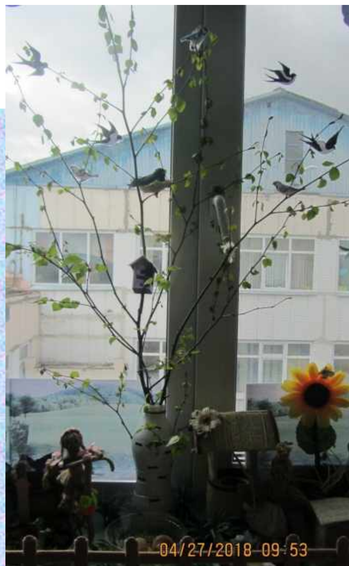
Наблюдение «Из каждой почки зеленые листочки»