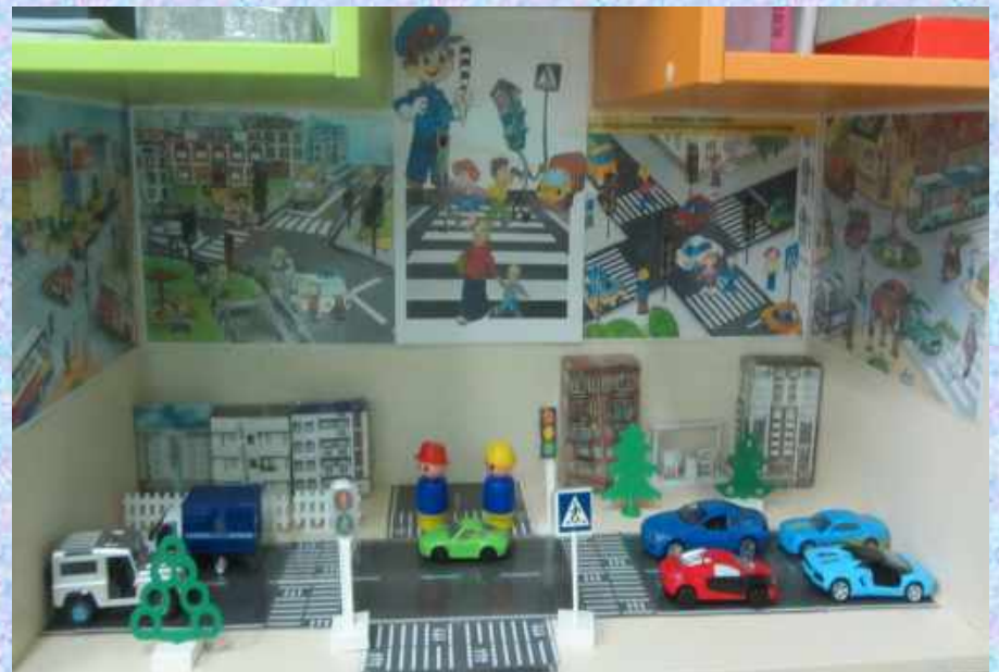
Уголок по ПДД «Перекресток»