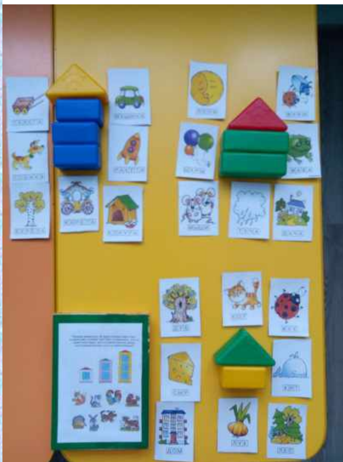
Дидактическая игра «Слоговые домики»