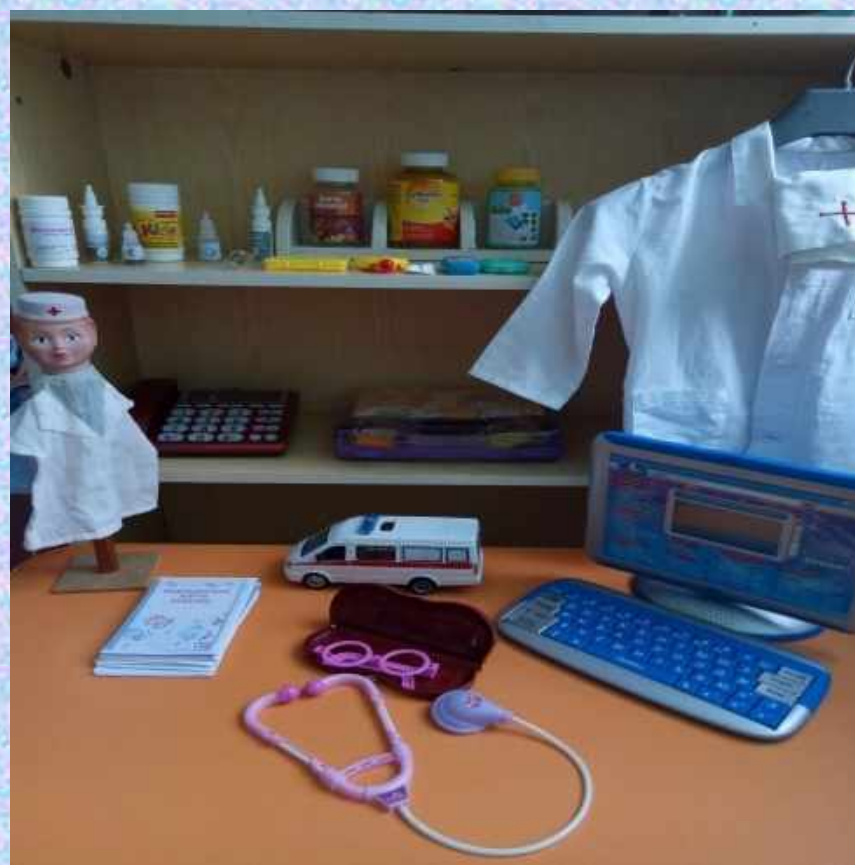
Сюжетно-ролевая игра «Больница»