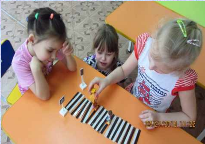
Дидактическая игра «Пешеходный переход»