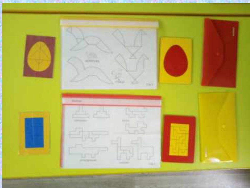
«Колумбово яйцо» и «Головоломка»