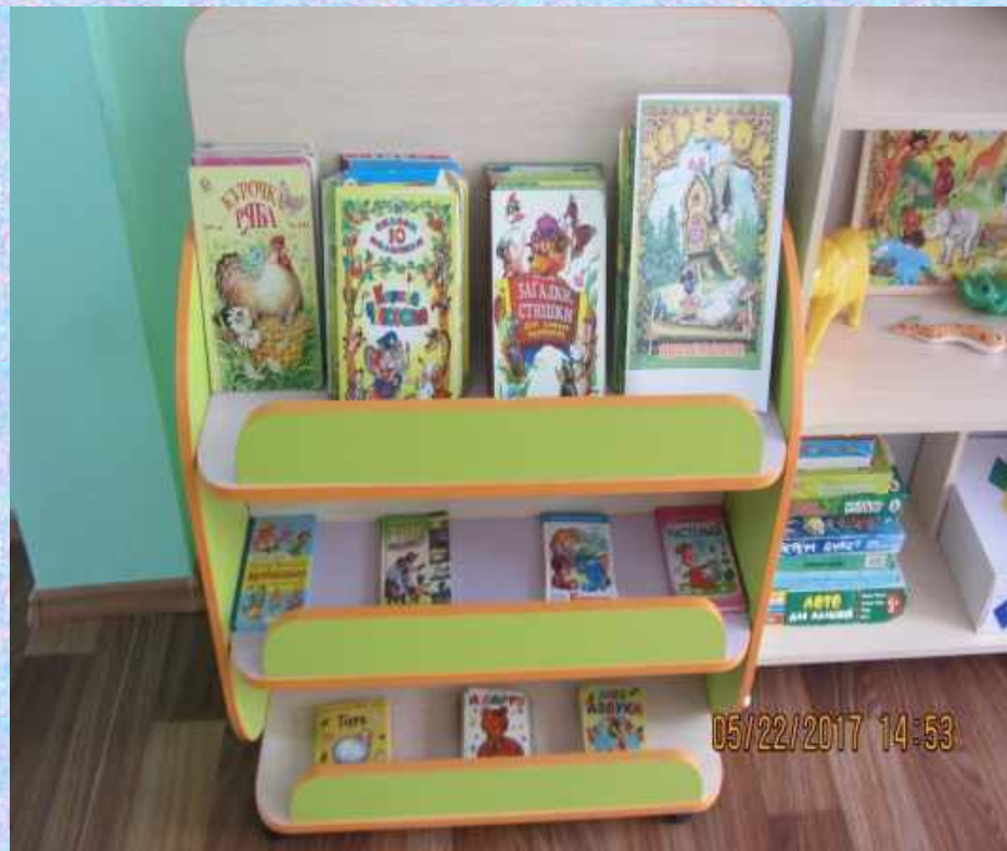
-В какой сказке живет Мышка?