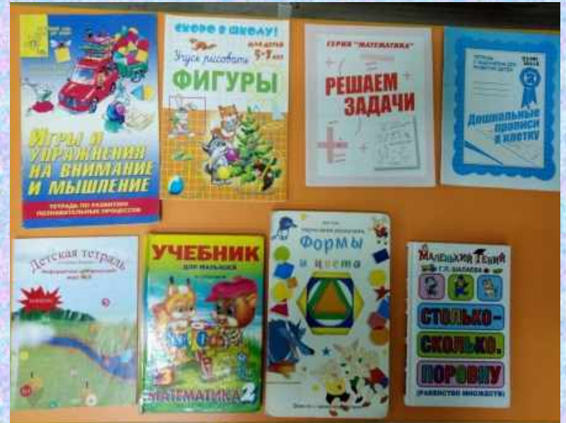
Книжные пособия по развитию логического мышления