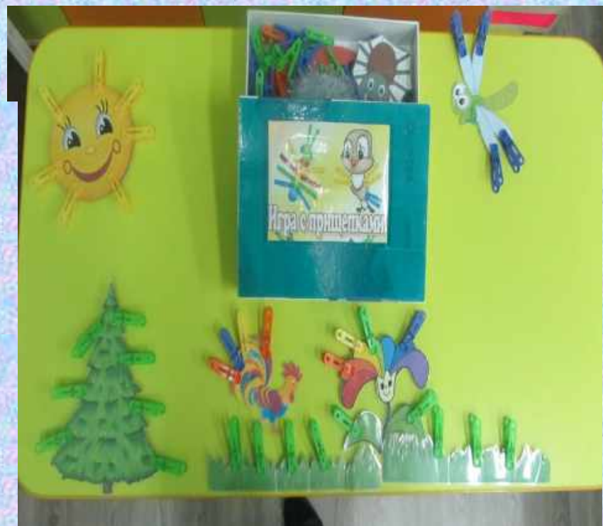
Игры с прищепками на развитие мелкой моторики для младших дошкольников