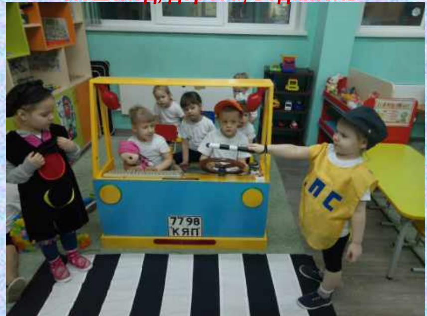
Сюжетно-ролевая игра «Пешеход, дорога, водитель»