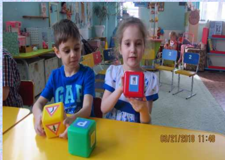
Дидактическая игра «Угадай дорожный знак»