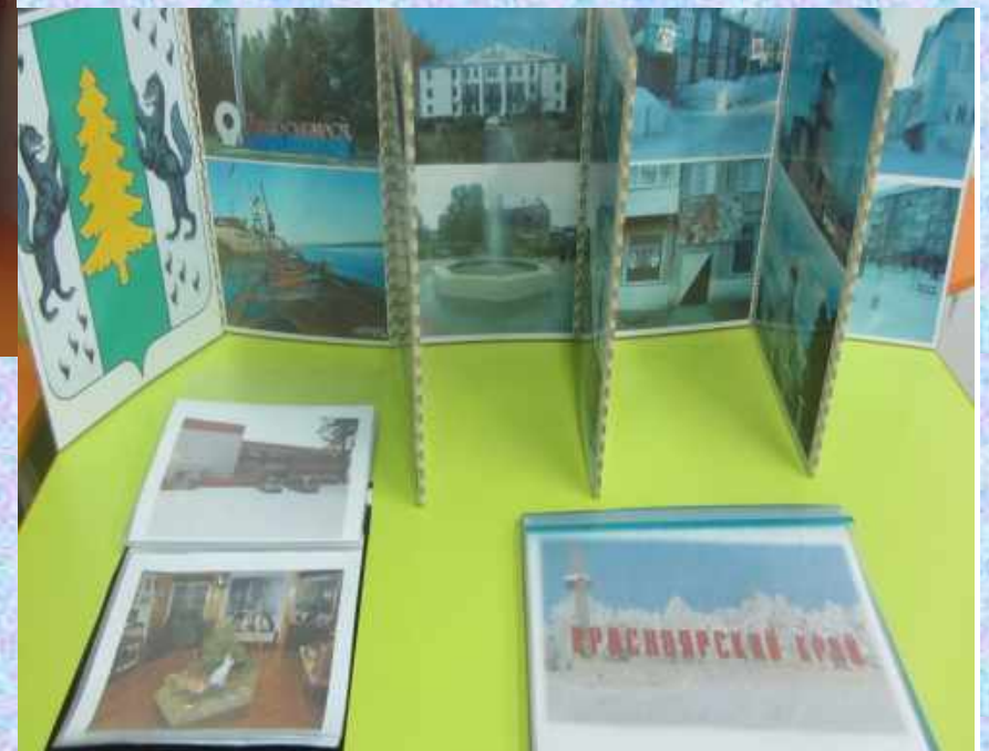
«Лесосибирск-мой родной город»