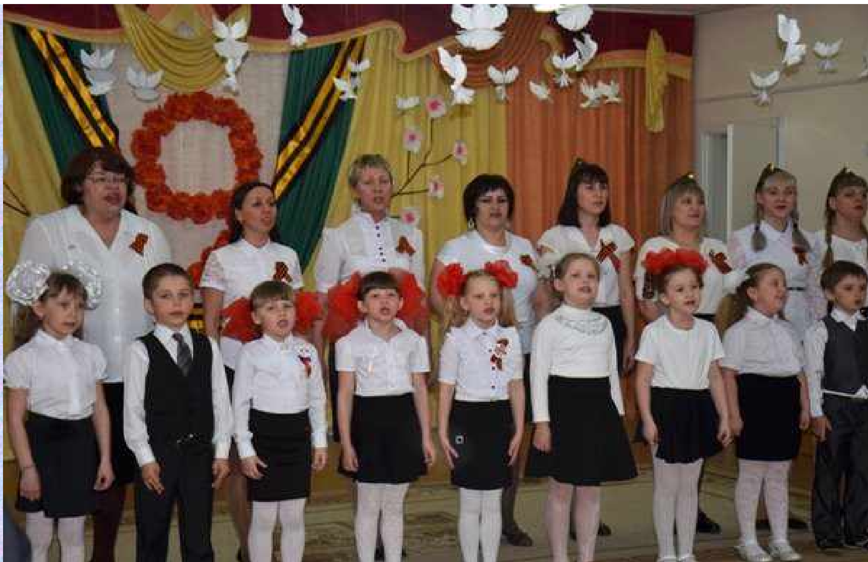
Совместное выступление с нашими юными талантами на празднике в честь 9 мая Песня «Катюша»