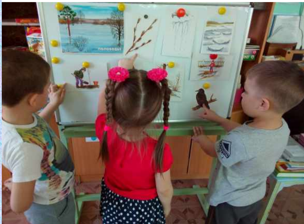
Тематическая неделя «Весна пришла»