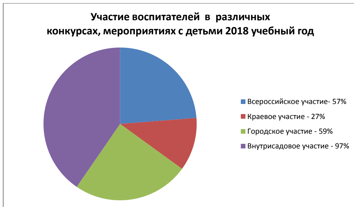
Диаграмма 4. Участие педагогов в конкурсах профессионального мастерства в 2018 году.