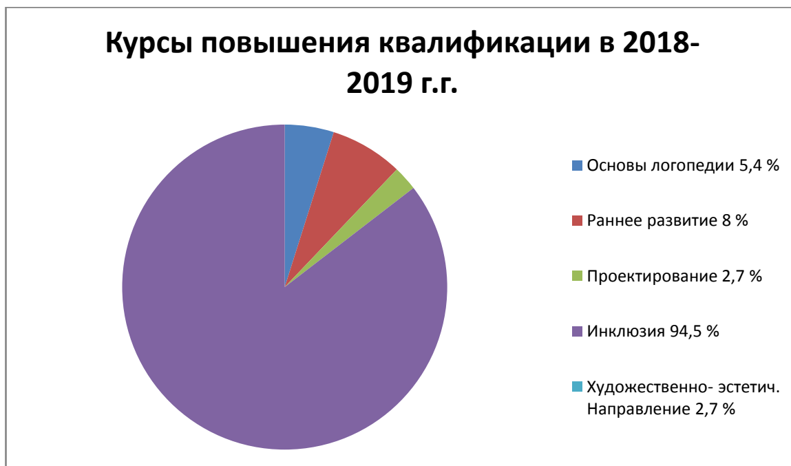
Диаграмма 6. Курсы профессиональной переподготовки, просмотр онлайн – вебинаров, участие ГМО, ГМП в 2018 учебном году.