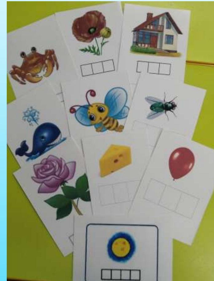
Игра «До и после»