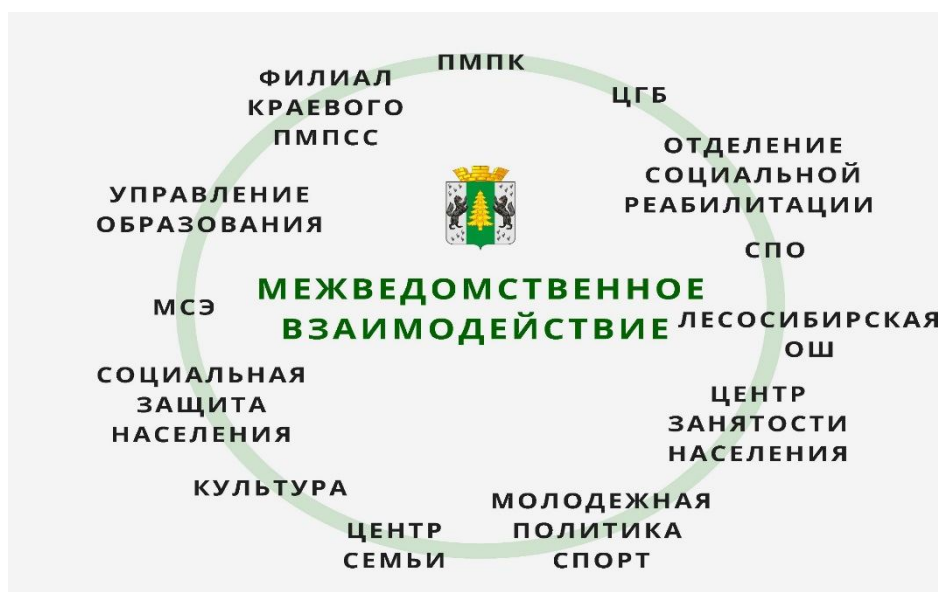
Рис. 1 Межведомственное взаимодействие

Структурно-функциональный компонент отражает межведомственное взаимодействие, распределение полномочий с соблюдением определенного баланса сил специалистов, направленных на особого ребенка.